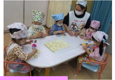
うさぎ組さん… 真剣です!!